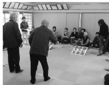
ふれあいサロン活動