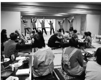
ひとり暮らし高齢者支援