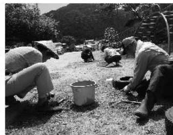
ボランティア活動