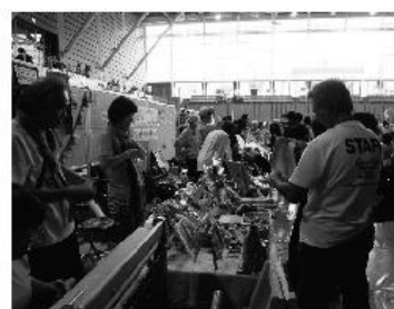
福祉ふれあいフェスタ