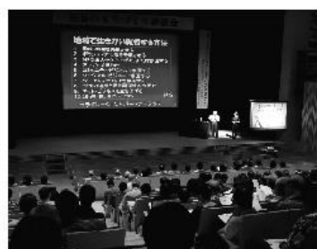
福祉のまちづくり講演会