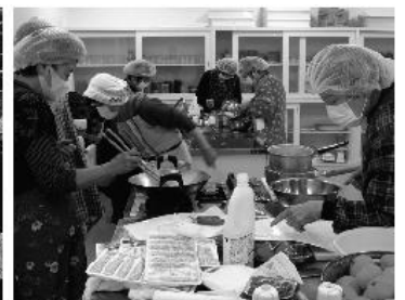
配食サービス活動