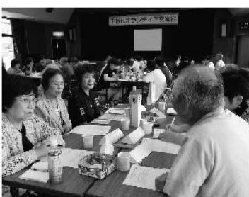
ボランティア交流会