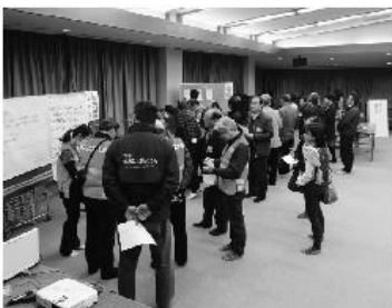
災害ボランティア訓練