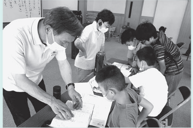
勉強時間を過ぎても集中して宿題に取り組む姿に感動しました。子ども達からパワーをもらったよ!(地域ボランティア)