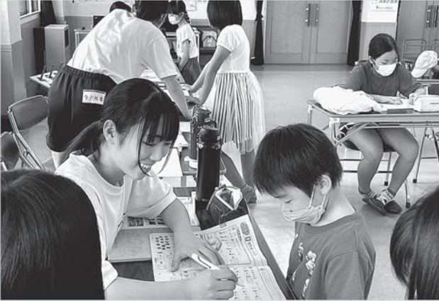
小学生だった去年、寺子屋に参加して楽しかったので、中学生になってボランティアで参加したよ♪(中学生ボランティア)

下呂市社協では、規則正しい生活をくずさず、安心して勉強できる居場所づくりとして、夏休み初期に市内7会場：計17回「社協寺子屋」を開催しました。延べ300人の小学生が参加し、夏休みの宿題に熱心に取り組みました。