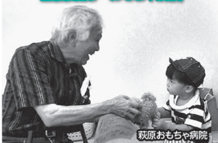
萩原おもちゃ病院