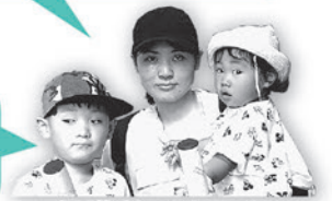
保護者 &amp; お子さん