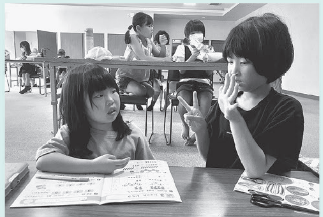
わからないところはすぐに教えてもらえるし、そばで見えてくれるからうれしい!(小学生)