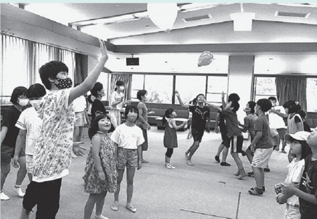
みんなと一緒にできる事があるので、寺子屋があって子どもも親も嬉しいです。(保護者)